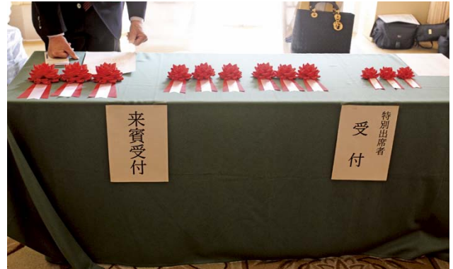
来賓受付に用意された胸リボン