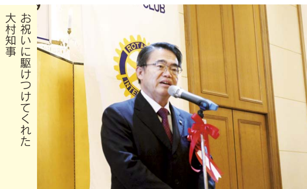
お祝いに駆けつけてくれた 大村知事