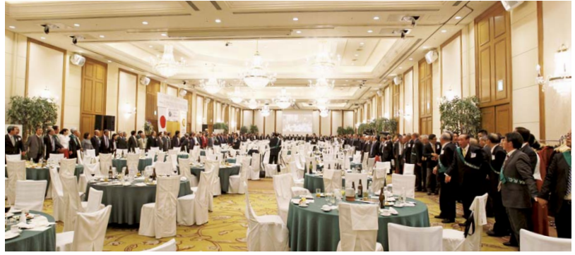
終宴は恒例の手に手とってのフィナーレです。