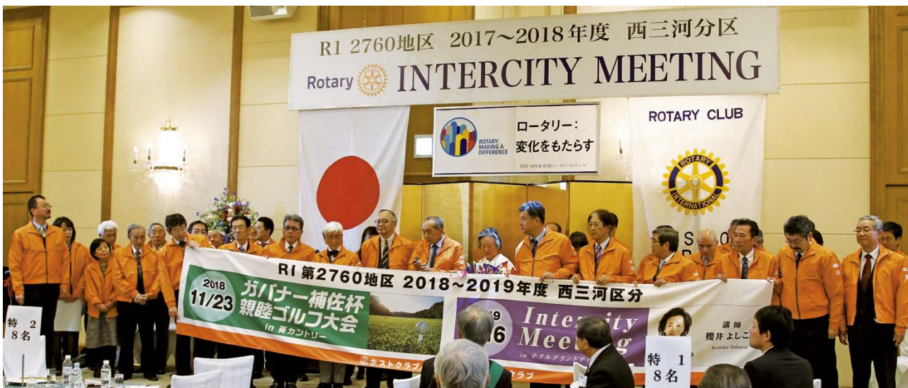
次年度ホストクラブ三河安城 RC のプレゼン