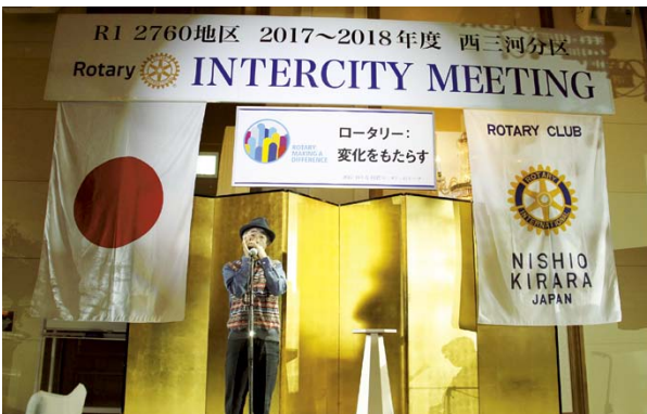
3人のミュージシャンの演奏によるオープニング