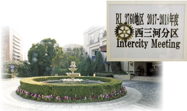
ロータリアンをお迎える会場玄関前の噴水