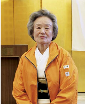
次年度 IM よろしく お願い申し上げます