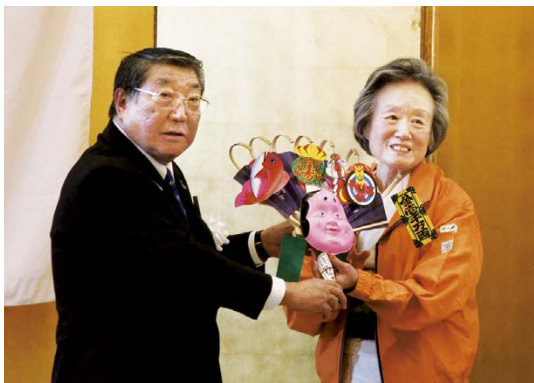
福を呼び熊手でハトンタッチ