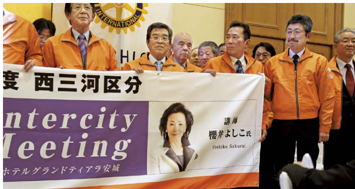
次年度講師は櫻井よしこさんです