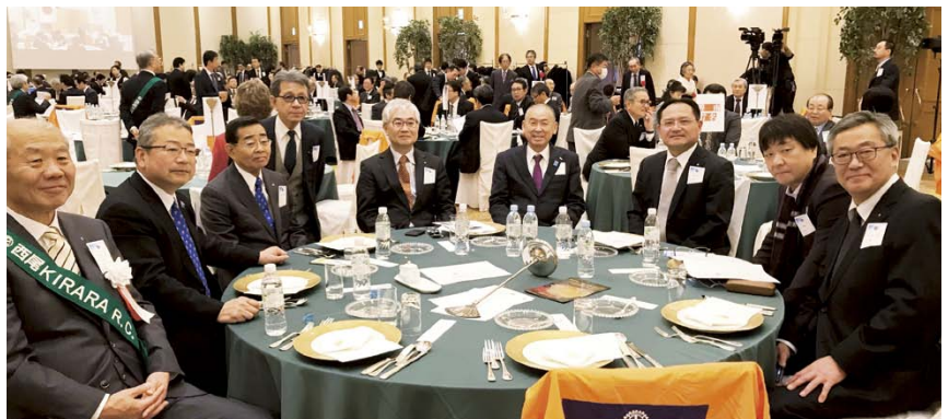
各クラブ会長テーブル