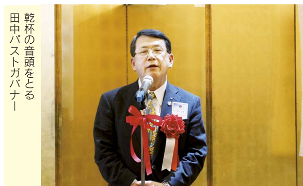
乾杯の音頭をとる 田中バストガバナー