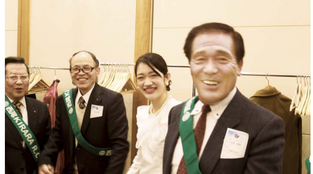
皆様ありがとうございました。