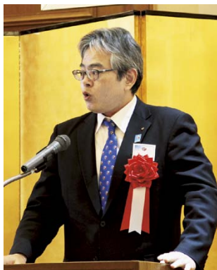
加藤地区幹事ご挨拶