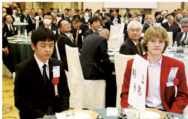
米山奨学生(左)と青少年交換学生(右)のお2人