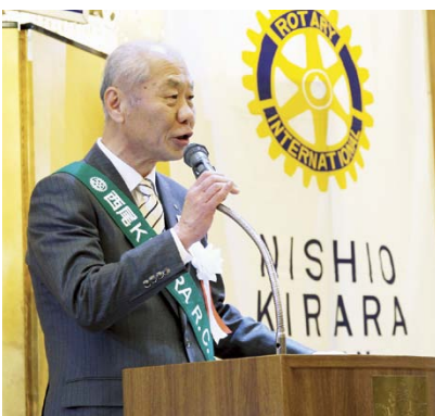
酒井会長歓迎のご挨拶